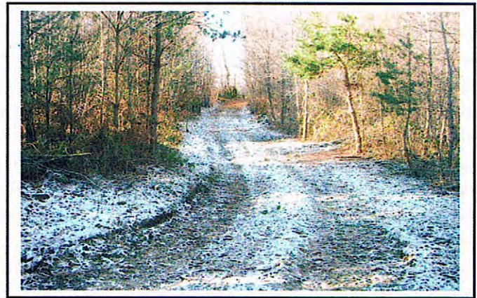
Entretien des chemins