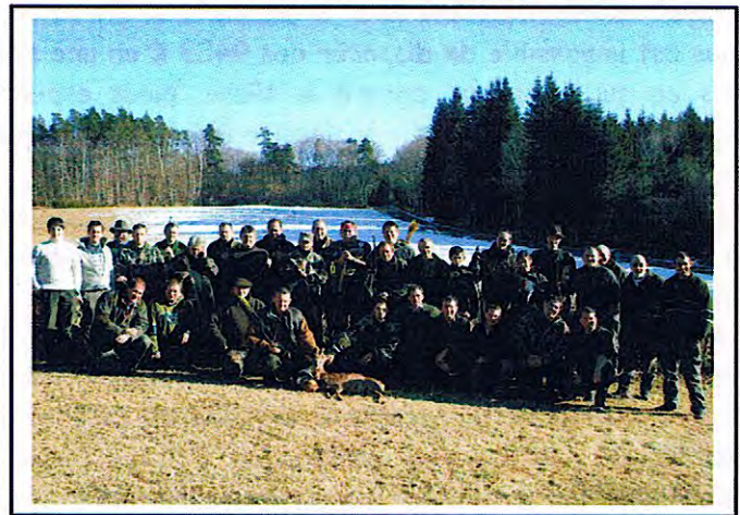
Chasse à l'arc