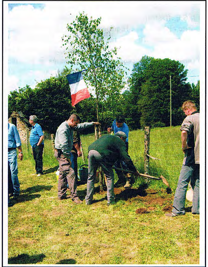
Plantation des Mais