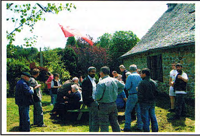
Plantation des Mais