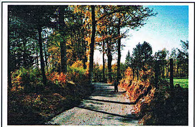
Nouvelle piste VC 2 E