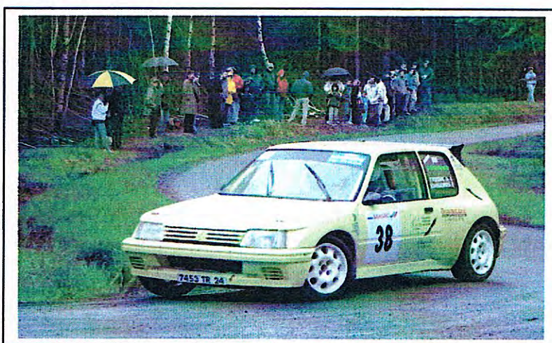
1 er Rallye Ventadour/Haute-Corrèze

Nous avons également accueilli, le 8 Mai, une manifestation totalement inédite sur notre commune avec le 1 er rallye automobile Ventadour / Haute-Corrèze. Organisée par l'équipe d'Egletons-Auto-Sport et comptant pour la Coupe de France des rallyes 2004, cette compétition a connu un beau succès populaire. Un nombreux public s'est en effet positionné en bordure de la D 60 pour admirer la soixantaine de bolides lancés à l'assaut des 6 km entre Le Jardin et St-Hippolyte. Equipages et organisateurs ont unanimement apprécié l'accueil réservé par notre commune ainsi que la qualité du parcours, même si la 1 ère descente a fait quelques victimes. A signaler que le futur vainqueur a parcouru les 6 km à presque 100 km/heure de moyenne et que le nom de notre commune a été cité plusieurs fois dans la presse régionale et la presse nationale spécialisée.