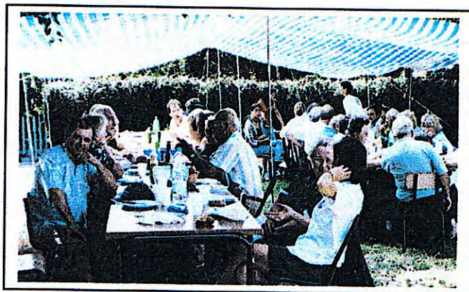
Repas Champêtre ( 26 Juillet 2003)