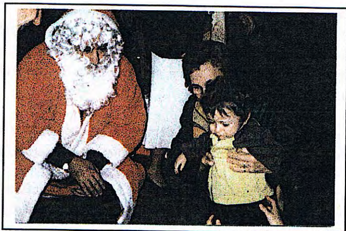
Noël des enfants (21 Décembre 2002)

Revivons maintenant en images quelques-unes des animations qui ont ponctué la vie de notre commune depuis un an.