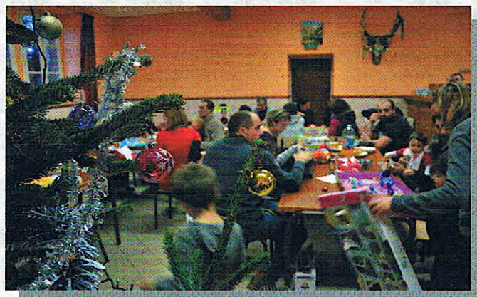
Noël des enfants (21/12/14)