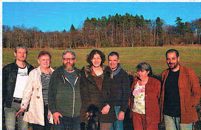
Election nouveau Conseil Municipal (23/03/14)