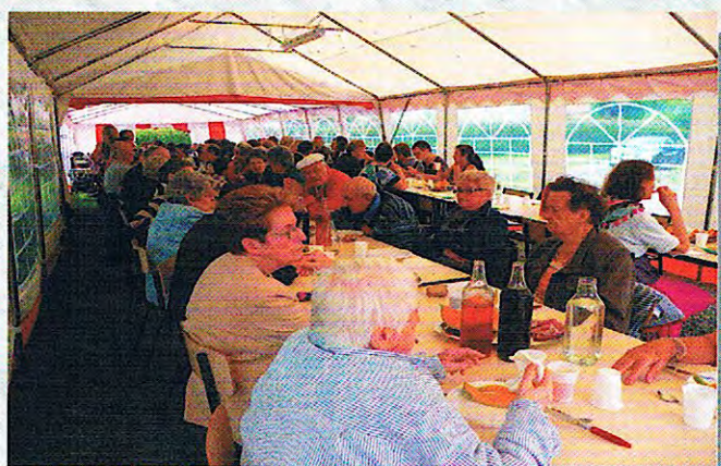
Repas champêtre (02/08/14)