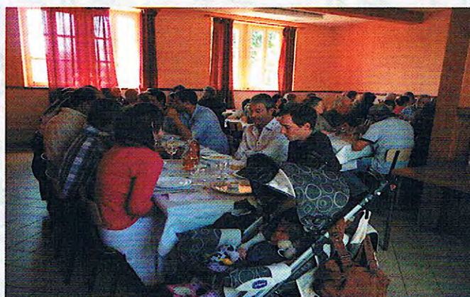
Repas annuel (12/04/14)