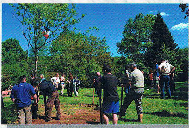
Plantation des Mais (17/05/14)