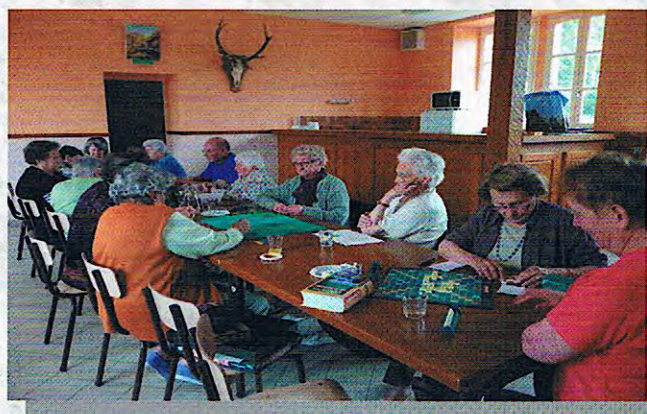
Animation du mercredi après-midi