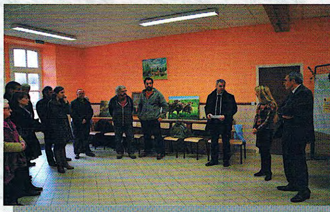
Inauguration travaux pistes (06/12/14)