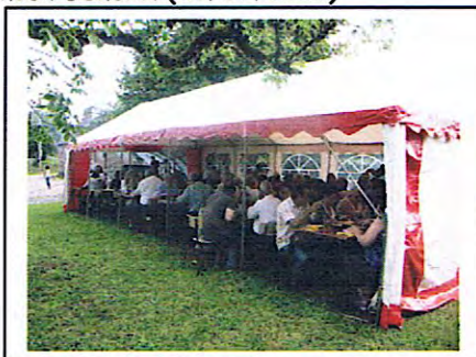
Repas champêtre (06/08/2011)