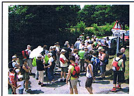
Randonnée avec le Conseil Général (28/07/2010)