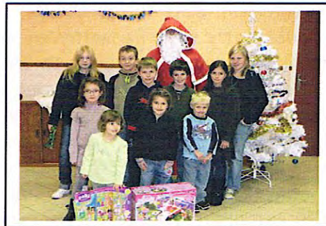
Noël des enfants (19/12/2010)