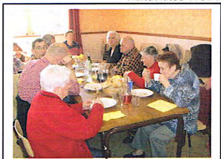
Repas communal annuel (30/04/2011)