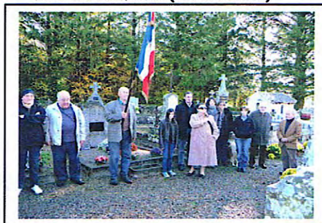
Cérémonie du 11 Novembre 2011