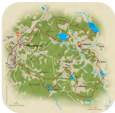
Randonnée Les étangs du Doustre (départ de Montaignac) 16 km / 4 heures / Facile

Montaignac-sur-Doustre est une commune nouvelle créée le 1er janvier 2022 après fusion des communes de Montaignac St-Hippolyte et Le Jardin. Sa superficie est de 32,7 km 2 et sa population de 674 habitants. Son altitude moyenne est de 600 m avec un territoire boisé aux deux tiers. Elle compte 2 églises romanes, une chapelle avec vitraux remarquables, un château privé, un chêne quadricentenaire « de Sully », plusieurs étangs et un superbe site naturel aménagé aux cascades du Doustre.