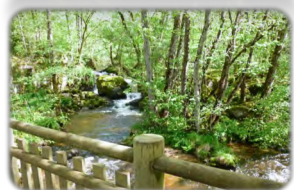
Cascades du Doustre