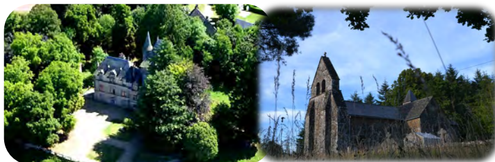
Château de Montaignac (en vente) / Eglise du Jardin