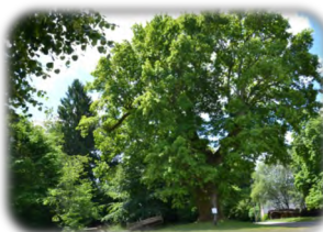
Chêne de Sully