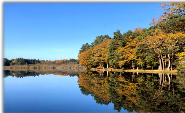
Etang de Gros à l'automne (cartes de pêche en vente mairie)