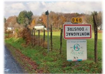
Photo réalisée sans trucage à la suite d'une action nationale des jeunes agriculteurs « On marche sur la tête », pour dénoncer l'excès normatif dont ils se sentent victimes.