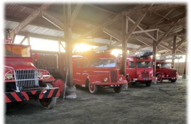
Les véhicules anciens ont déménagé dans un nouveau local