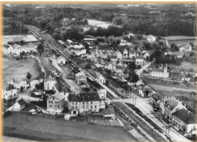
Au centre-droit de la photo, la rue de l'Artisanat dans l'entre-deux guerres avec les grands bâtiments SERVE

Un grand merci à Daniel Vigouroux pour son aide et sa précieuse documentation.