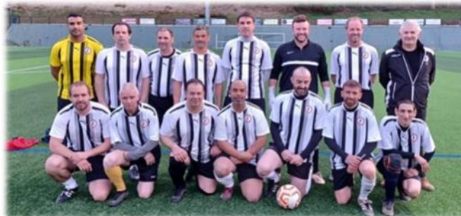
Equipe des vétérans