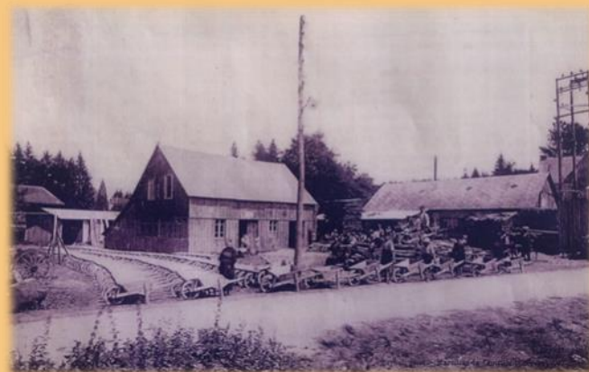
La menuiserie BECOT et les brouettes SALVANEIX